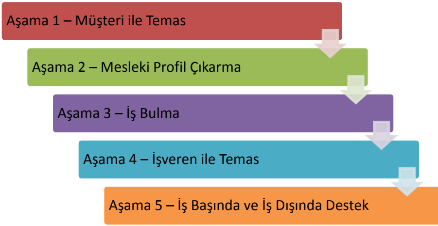
Sekil 2: Beş aşamalı Destekli İstihdam süreci

Bu yöntemin Türkiye’de uygulayabilmek için şimdi bu beş aşamayı detaylı olarak inceleyeceğiz. Destekli İstihdam ilkelerinin arka planına dayanarak engelli bireylerle nasıl çalışılır? Mesleki profil çıkarma nasıl yapılır? Muhtemel işverenlerle nasıl irtibata geçilir ve işverenlerin engelli bireyleri istihdam etmesi nasıl sağlanır? Ve son olarak engelli bireyler doğrudan iş yerlerinde nasıl desteklenebilir?