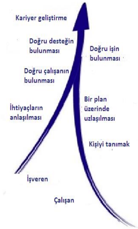
Sekil 1: Farklı müşteri ihtiyaçları 3

Engelli bireylerin bir iş yerine dâhil edilmelerinin sağlanması ve bunun etkili ve sürdürülebilir olması için, Destekli İstihdam süreci çalışan ve işverenlerin ihtiyaçlarını dikkate almalıdır. İşverenlerin korkularının ve sonuçta ortaya çıkan ihtiyaçlarının anlaşılması ve onlar için doğru çalışanın bulunması önemlidir. İşe almada doğru desteğin sağlanması gereklidir. İş alma sürecinde doğru desteğin sağlanması gerekir ve sunulabilecek destekler “engellilik bilinci eğitimi, hükümet desteği/fon programları hakkında bilgi sahibi olmayı ve sağlığa, güvenliğe ve engellilerin istihdam konularına getirilebilecek pratik çözümleri” (EUSE Aracı, 2010, s.32) olabilir. Ayrıca engelli bireylere ve onların iş arkadaşlarına yönelik mesleki destek, her iki taraf ile birlikte planlanmalıdır. Engelli bireye iş