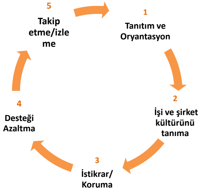
Sekil 6: İş Desteği Süreci (EUSE Aracı, 2010, s. 94)

Yandaki şekilde bu aşamada önerilen eylem modeli gösterilmektedir. İlk tanıtım ve oryantasyon dönemi yeni çalışanın istihdam edilmesi ile başlar. Diğer çalışanlarla tanıştırma, görev ve sorumlulukların üstlenilmesi, önemli konulara (kurumsal, sosyal dâhil olma, v.b.) temas edilmesi ve engelli bireyin iş yerine dahil edilmesidir. Bu aşamanın başından itibaren Dİ çalışanı muhtemel doğal